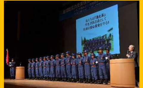
みよし市消防団機能別分団「ちいむともいき」 (地域防災力充実強化大会 in 愛知 2017 平成 29 年 10 月 24 日)

消防団員が減少し、平均年齢の上昇が進む中、大学生・専門学生等若い力の消防団活動への参加が強く期待されています。