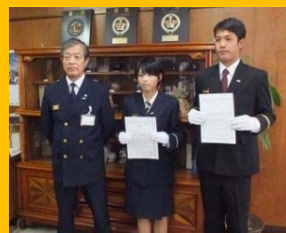
学生消防団活動認証状交付式(瀬戸市 平成27年5月14日)

消防団員が減少し、平均年齢の上昇が進む中、大学生・専門学生等若い力の消防団活動への参加が強く期待されています。